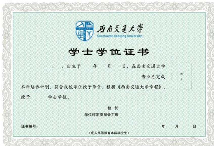
成人教育学位证书样张